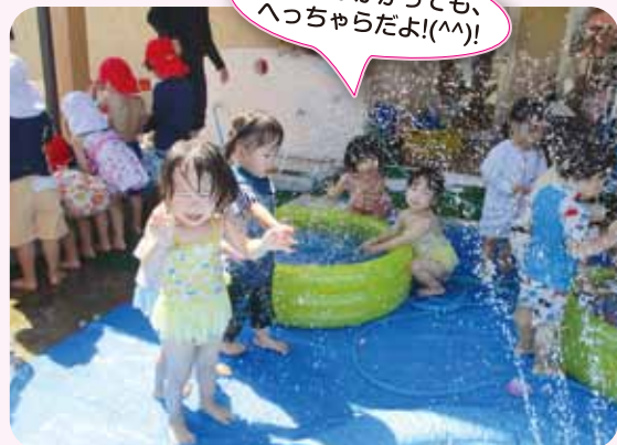
顔に水がかかっても、 へっちらだよ!(^^)!