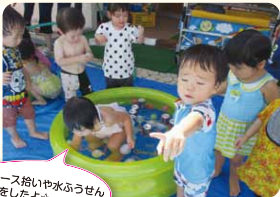
ジュース拾いや水ふうせん 取りをしたよ☆