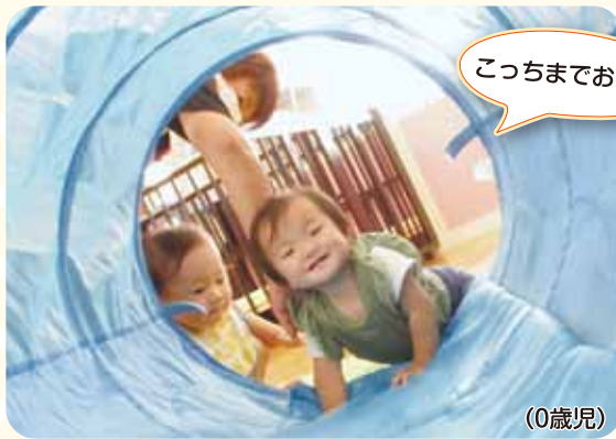
こっちまでおいで