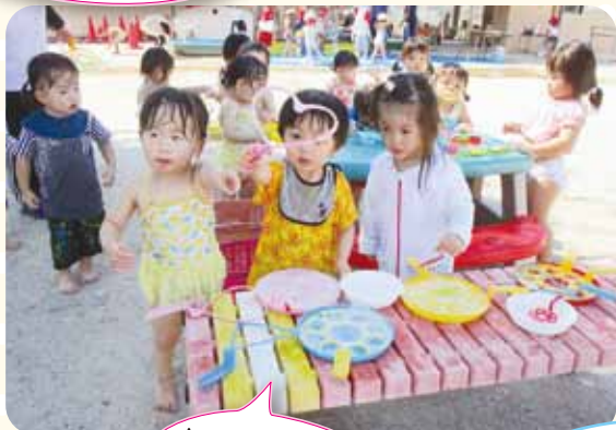
しゃぼん玉遊び 楽しいな♪