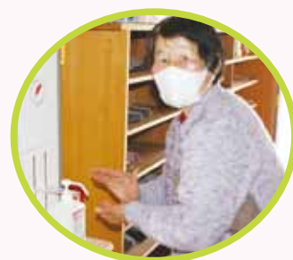
西本郷公民館(ミニデイにて)