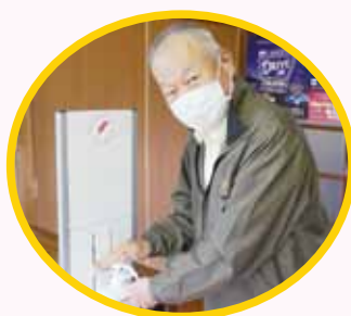
高樋公民館(ミニデイにて)