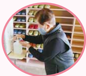
西大刀洗公民館(ミニデイにて)

日頃より地域で開催されているミニデイサービス（高齢者のサロン）は共同募金からの配分を受け実施されている事業のひとつです。しかし、令和2年度は新型コロナウイルス感染症の影響を受け、開催できない地域が多くありました。そこで、配分金に余裕ができた分を地域で使っていただこうと検討した結果、消毒台を配布し各公民館に設置していただくこととなりました。公民館でも感染症対策をされていますが、拡大防止のひとつとしてご活用いただければと思います。