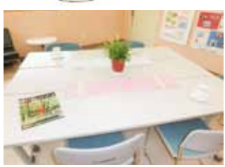
ゆっくりくつろげるスペース

外に出る第一歩、何かやってみようの第一歩のお手伝いができる場になればと思います。