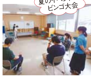
夏のイベント ビンゴ大会

申込み・問合せ 大刀洗町社会福祉協議会 TEL:0942-77-4877 FAX:0942-77-6220