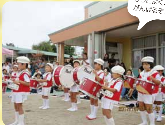
カッコよく、 がんばるぞ!!