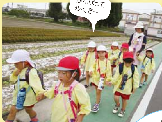
がんばって 歩くぞ〜

気候のよい季節、園外保育に行きました。園の近くを散歩しながら秋を散策しました。お昼はお家の方の手づくりのお弁当をおいしくいただき、大満足の子どもたちでした。