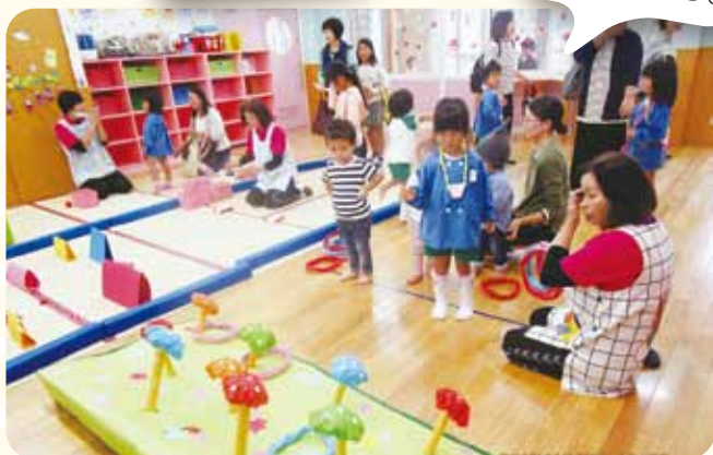
全体保育参観 それっ、は〜いって!