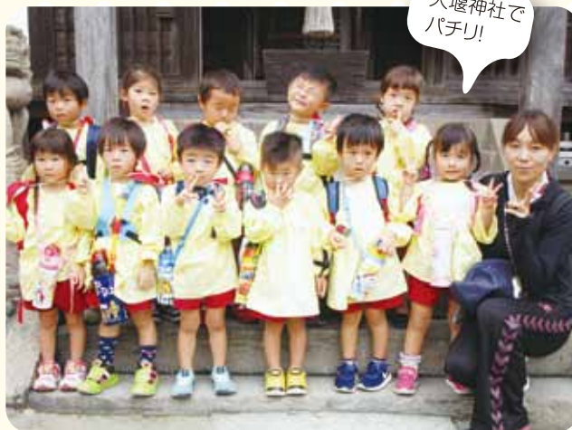
大堰神社で パチリ!