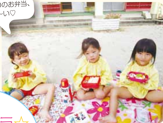
手づくりのお弁当、 おいし〜い♡