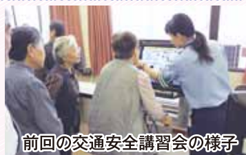
前回の交通安全講習会の様子

日時：12月8日(金) 10時より 会場：ドリームセンター2階 展示ホール 内容：警察の方をお招きして機材を使った交通安全講習会を行います。交通事故にあわない、起こさないためにも、この機会にお誘いあわせの上、楽しくご受講ください。