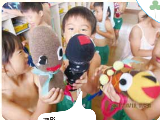
造形 すてきでしょ〜☆ 上手にできたよ!!

年長児のマーチングでスタート。お家の人が出てときどきしたけど、一生懸命がんばりました。今日のぼくたち、わたしたち、カッコいいでしょ〜☆