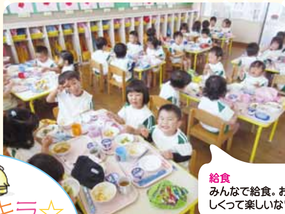
給食 みんなで給食。おいしくって楽しいな♡