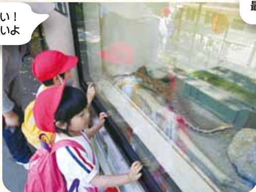
すごーい！ へび長いよ

親子バス遠足で福岡市動植物園に行きました。遠足を楽しみにしていた子どもたちは、お家の方が作って下さったお弁当をおいしそうに食べたり、キリンや象などたくさんの動物を見て喜んだり、楽しい遠足になりました。