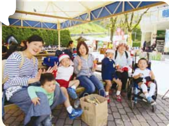
ソフトクリームも 最高