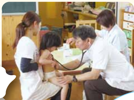
内科健診 ちょっぴり ドキドキ..