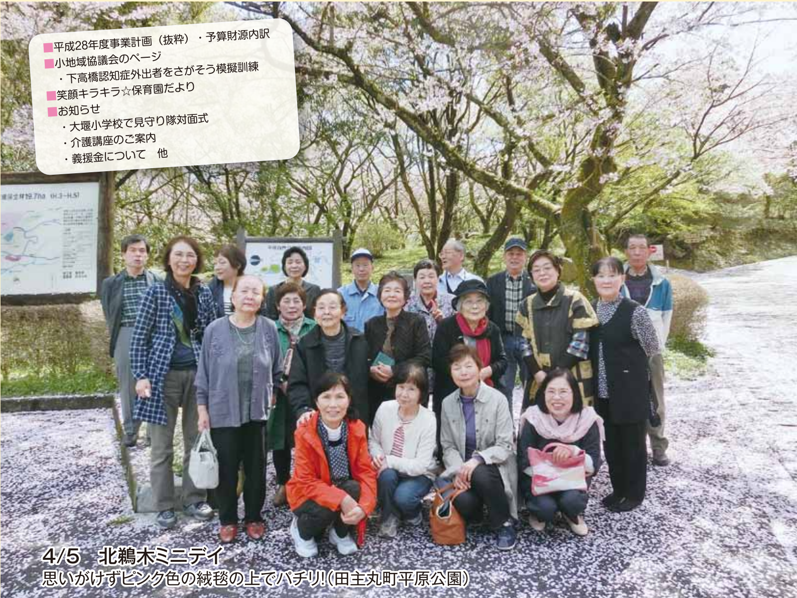
4/5 北鷓木ミニデイ 思いがけずピンク色の絨毯の上でパチリ!(田主丸町平原公園)