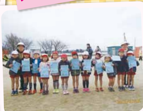
2/16 マラソン大会 きつかったけど、最後まで走りぬき気持ちよかったです!!

この季節ならではの遊びを通して異年齢児とふれ合ったり、同級生と一緒に何かに取り組んだりして、心育て・身体育てをしています。4月には新しい友だちを迎え進級する子どもたち。今年度も大きく成長しました。来年度のいろいろな出会いを楽しみに成長します。