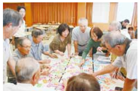
地域包括ケアシステム勉強会

地域の課題はそこに住む人が一番よく知っています。従来通り行政が決めて進めるのではなく、困りごとや望むサービスを提案し、それを実現していくための仕組みづくりを、関わる人みんなが協議し形にしていく「協議体」が地域包括ケアシステムの重要なものとなっています。今後は、従来介護サービスの給付のみに使われていた事業費を、協議体の提案について地域の活動としても使い広げていくことができる柔軟性をもった仕組みになります。自分の地域を良くするための取り組みやアイデアをどんどん提案してほしいと考えています。