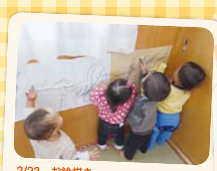
2/23 お絵描き 皆で並んでグルグル、「うまく描けたですよ!」