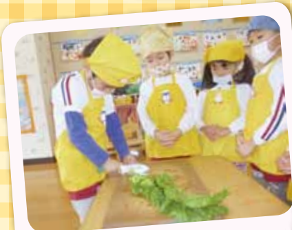
1/13 クッキング 「白玉雑煮」をみんなで分担して作りました！包丁も上手になりました。