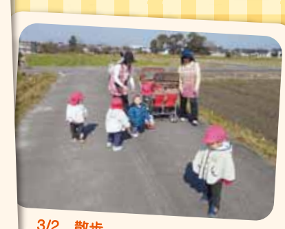
3/2 散歩 しっかり歩いて菜の花や土筆を見つけました