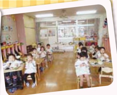
2/3 節分 豆まきして悪い鬼は逃げて行ったぞ！給食で恵方巻!! しっかり南南東を向いて...しずかにパクツ