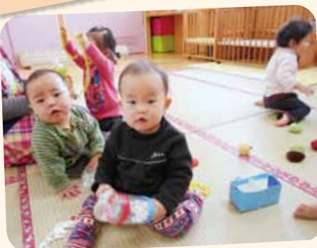
2/24 自由遊び お気に入りのおもちゃでご機嫌、「いい音するよ～」。何でも口に入れて確認していた0歳児も、今はお気に入りのおもちゃを出し入れしたり音を楽しんだり遊びの幅も広がっています。友だちにも関心を示すようになり一緒に遊ぶ姿も見受けられます。小さいながらもお友だちの存在は大きいですね。