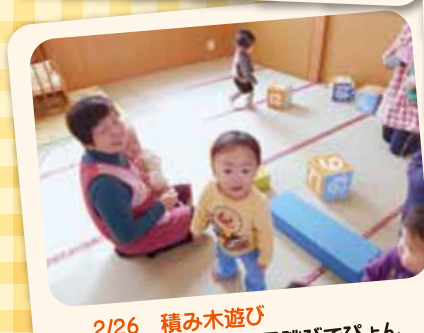
2/26 積み木遊び 積み木の上から両足跳びでびよん着地大成功!