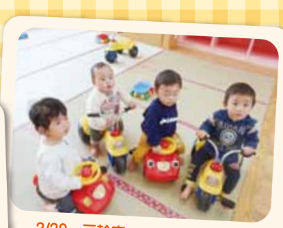
2/29 三輪車 お友だちと仲良く安全運転