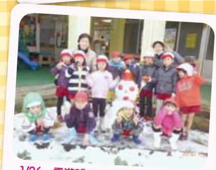
1/26 雪遊び わ～いわ～い!! 雪遊びは楽しいな!

この季節ならではの遊びを通して異年齢児とふれ合ったり、同級生と一緒に何かに取り組んだりして、心育て・身体育てをしています。4月には新しい友だちを迎え進級する子どもたち。今年度も大きく成長しました。来年度のいろいろな出会いを楽しみに成長します。