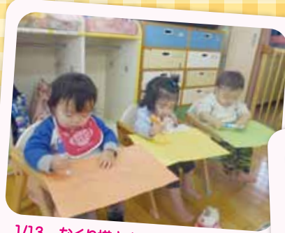
1/13 なぐり描き(ひよこBくみ) マジックで描くのはたのしいな～