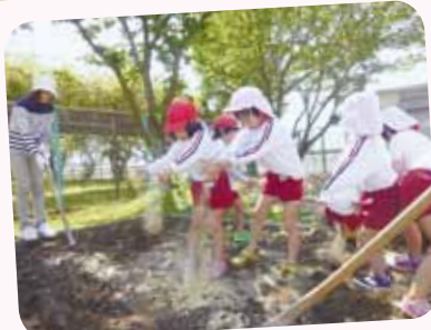
4/22 畑づくり 年長さんが、野菜くずや米ぬかを畑に混ぜ土づくりを始めました。