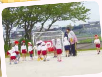
4/14 体育教室 年中さん、初めての体育教室に張り切って参加しました。