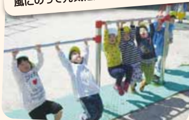
4/22 鉄棒にぶら下がって「ヤッホー」 天気がいい日は運動あそび♪

今年度も「やさしさ・たくましさ・協調・意欲・感謝」の保育目標を掲げ、食育活動・身体づくり・造形活動など、子ども達と寄り添いながら地域に愛される保育園を目指し、職員一同連携して取り組みます。