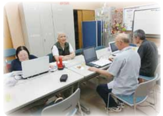
講師をつとめる凸凹の会(点訳サークル)

障がいは特別なことではないので、恐がらずに健常者と同じように声をかけてもらえればと思います。また、スーパーや公共施設など身近なところに、点字や点字ブロックなど見えない人への工夫がされているか見てほしいです。そして、将来、障がい者への視点を持った発想が出てくるといいと期待しています。