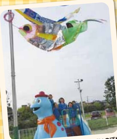
4/13 年長さんが作った大きなこいのぼり風によって元気に泳いでいますよ！