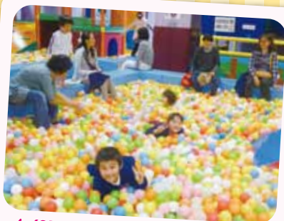
4/21 遠足 親子バス遠足で、北九州子どもの館に行きました。楽しかったよ！

5/31 にある小学校の運動会へ向けて練習をしています。 年長さんはバルーンに挑戦します。その中にリズムや馬跳びも取り入れており、全身を使って活動することの楽しさを味わいながら、目標に向かって友だちと協力する大切さを感じていけるように練習しています。