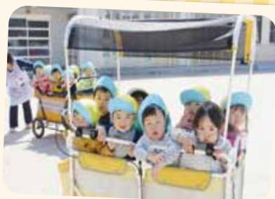
4/15 散歩車に乗って園庭めぐり♪ 保育園にも慣れてきました！