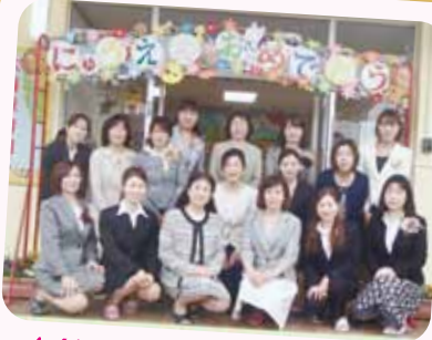
4/4 入園式 職員です。よろしくお願いします