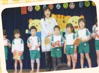
4/20 誕生会 また1つお兄さん・お姉さんになりました