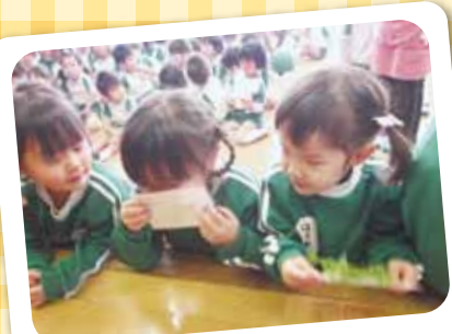
1/7 七草 色んなお野菜があつたよ！興味津々。