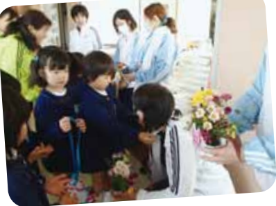
11/21 職場訪問 年長児がアレンジした花をプレゼントしました