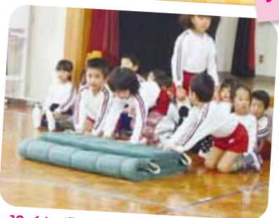
12/4 運動遊び 予定していた山登りが中止に…でも、みんな運動遊びを楽しみました