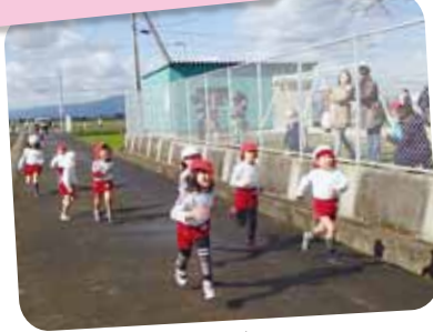
12/6 マラソン大会 農道のコースを最後まで走りぬきました