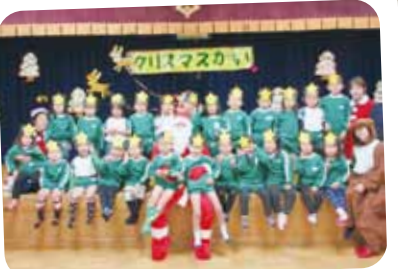
12/25 クリスマス会 サンタクロースがやってきました！プレゼントもらったよ！