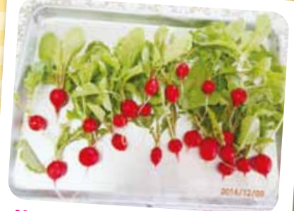
12/9 ラティッシュ収穫 こんなに立派に育ちました。マヨネーズをつけて美味しくいただきました