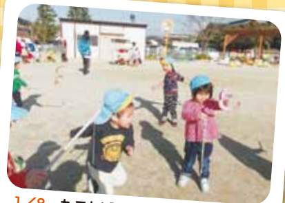
1/8 たこあげ 伝承遊び、たこあげしたよ!!

楽しみにしていた発表会。自分たちでなりたい役を決めて練習に入ったので、すぐに台詞を覚えることができていました。当日は緊張している子もいましたが、さまざまな場面でたくさんの成長が見られましたよ。これからの成長がまた楽しみです