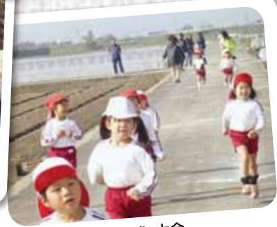
12/7 マラソン大会 みんな良く頑張りました！