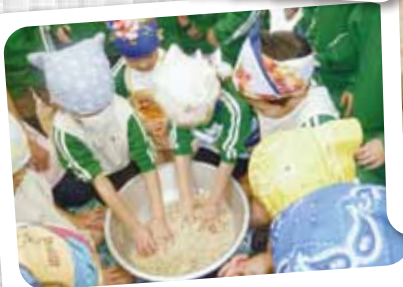
みそづくり② つぶした大豆とこしをよ~く混ぜ 合わせます