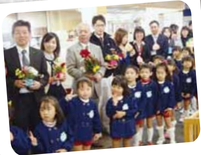
11/22 職場訪問 いつもお仕事ご苦労様です☆