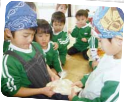
12/27 みそづくり① 大豆をよくつぶします