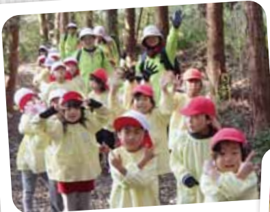
12/4 花立山登山 汗をかくって気持ちいいね♪