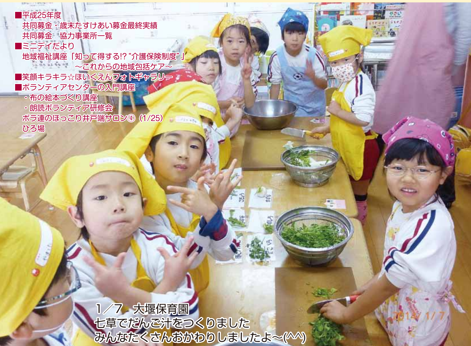
1/7 大堰保育園 七草でだんご汁をつくりました みんなたくさんおかわりしましたよ～(^^)

■ 社会福祉法人 大刀洗町社会福祉協議会 〒830-1201 大刀洗町大字富多819 TEL/0942-77-4877 Fax/0942-77-6220 ■ 大堰保育園 ■ 本郷保育園 〒830-1205 〒830-1211 大刀洗町大字守部465-5 大刀洗町大字本郷899-1 TEL/0942-77-1402 TEL/0942-77-2220 URL http://www.tachi-shakyo.or.jp