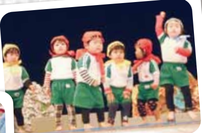
12/14 生活発表会 小さくて可愛い忍者さんが登場しました。 きまってるでしょ!!