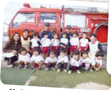
11/21 ふれあい防火訓練 「お・は・し・も」ちゃんと覚えてるよ！