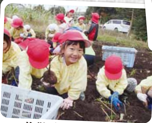
11/11 さつまいも堀り おいも見~つけた♪見て見て~♪