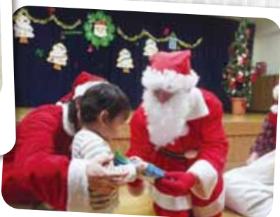
12/25 クリスマス会 待ちに待ったサンタさん登場に大喜び ☆プレゼントをもらったよ!!