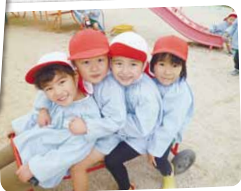
12/17 戸外遊び 寒さなんてへっちゃら☆お外大好き♪