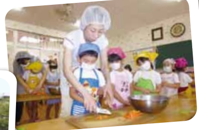
7/10 クッキング つき組が包丁を使って野菜スティックを 作りました