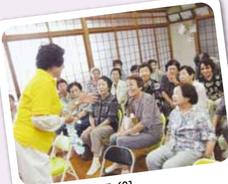
高樋ミニデイ 7/31 楽しいお話のようですね〜