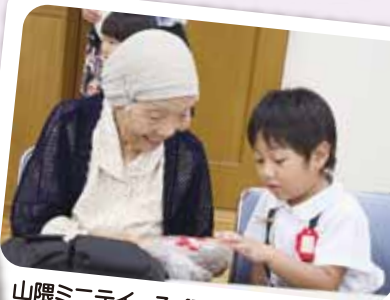
山隈ミニデイ 7/10 「何がはいつているのかな〜?」