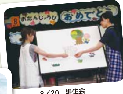
8/20 誕生会 8月生まれのお友だち♪ ☆Happy Birthday☆