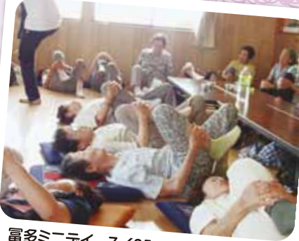
富多ミニデイ 7/25 みんなで若返りの(?)運動をしています