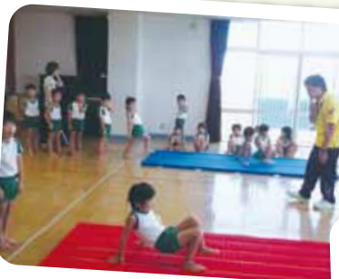
8/21 Webスポーツ(器械体操) ころんと転がってしまうのがおもしろーい!