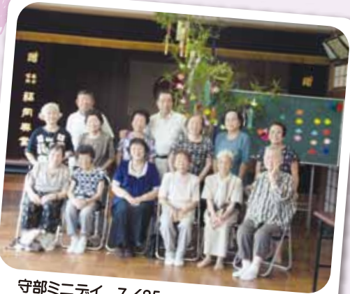
守部ミニデイ 7/25 きれいな七夕飾りができました。お願い事は…