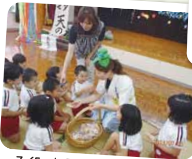
7/5 セタまつり 織姫と彦星だ!! お菓子ありがとう