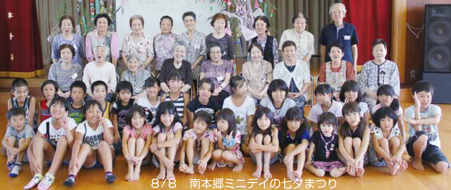
8/8 南本郷ミニデイの七夕まつり 地域の子どもたちと七夕飾りを楽しくすごしました。