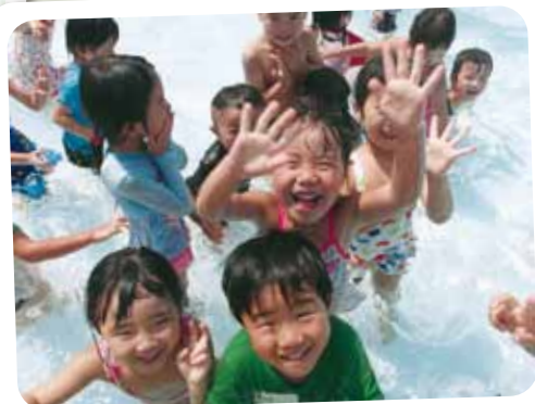
☆プールあそび☆ プールあそびって楽しい♪