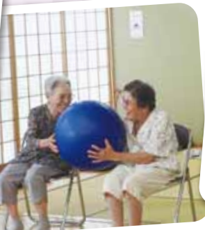
稲数ミニデイ 7/12 ニコニコしていますが、頭の体操を やってるんですよ〜、すごいでしょ?