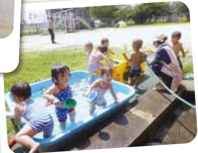
7/9 プール遊び プール、気持ちいいな~