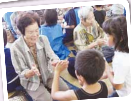
北山隈ミニデイ 7/9 子どもたちといろいろな遊びをしました