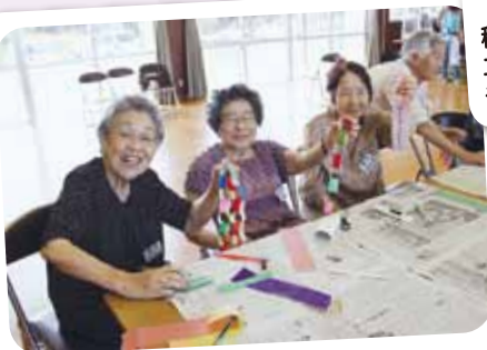
南本郷ミニデイ 8/8 「私たち、大正〇〇年生まれのおともだち (同級生)なのよ〜」