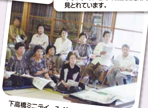
下高橋ミニデイ 7/8 真剣な表情…、実は「相続のお話」を 聞いているところです