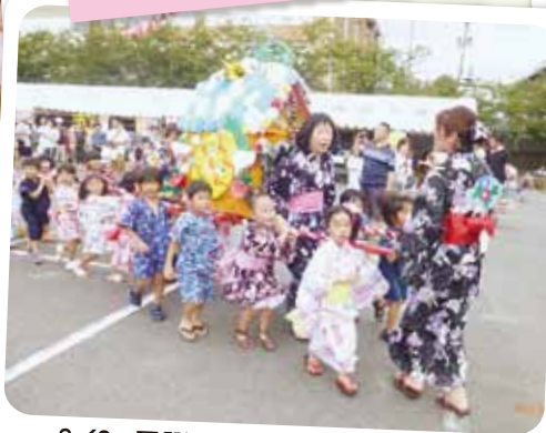
8/3 夏祭り お神輿担いで「ワッショイ! ワッショイ!!」