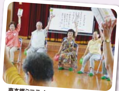
東本郷ミニデイ 8/7 元気ハツラツ、いい笑顔です!