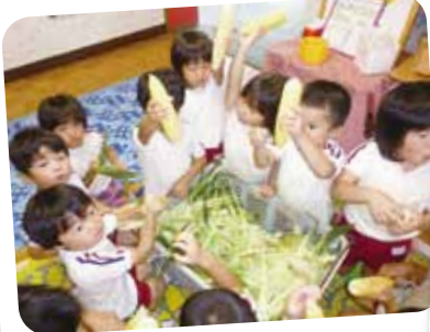
7/4 とうもろこしの皮むき 大きくておいしそう! 早く食べたーい!!