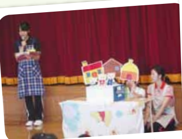
8/27 実習生による出し物 実習生の手作りペーパーサート、 かわいかったね~♪