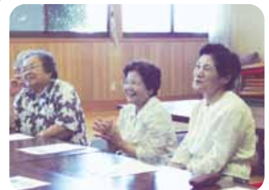
上高橋ミニデイ 7/10 ボランティアさんの熱演に思わず 見とれています。