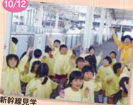
新幹線見学 新幹線に大興奮！「えらい速かったね」