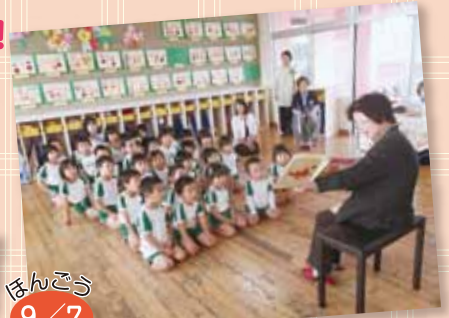
わかば大学交流会 おいしいちゃん、おばあちゃんたちと絵本や手遊びを楽しみました！