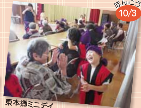
東本郷ミニデイ エイサーを披露したり、手遊びをしたり楽しい時間を過ごしました！