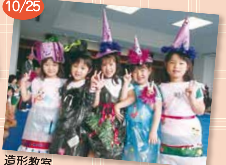
造形教室 自分たちで作った衣装でファッションショー、ステキでしょ？