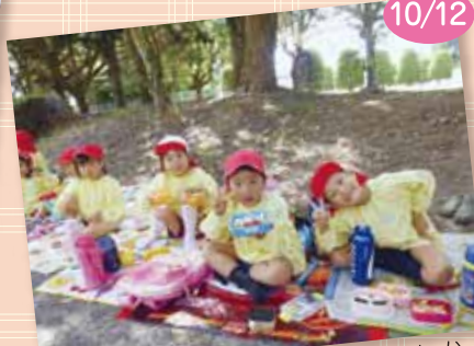
愛情たっぷりお弁当、とってもおいしかったよ