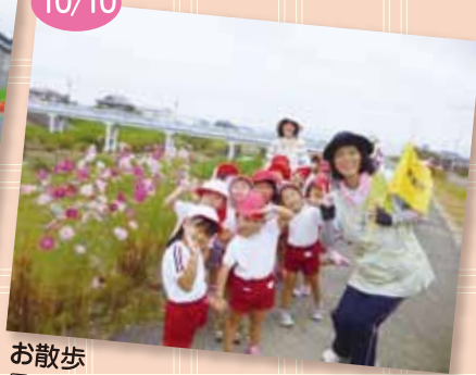
お散歩 目北橋から江戸橋までお散歩、楽しい思い出ができたよ