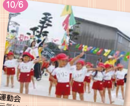
運動会 元気いっぱい踊りを披露してくれました