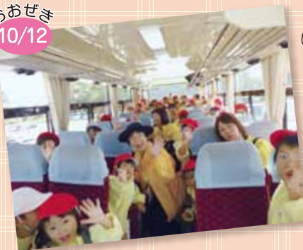
新幹線見学 バスに乗ってワクワク！「行ってきます」