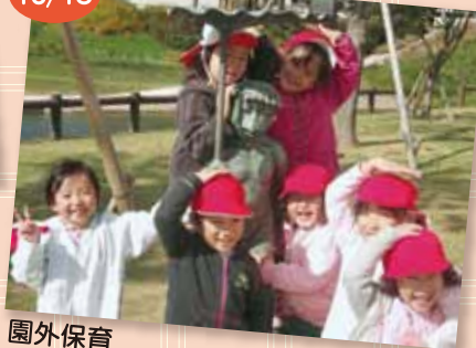
園外保育 北野のコスモsparkに行ってきました！