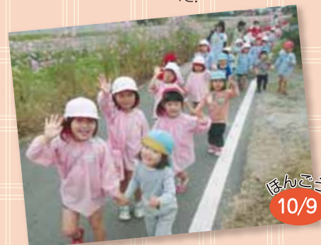
お散歩 本郷神社にお散歩に行きました！