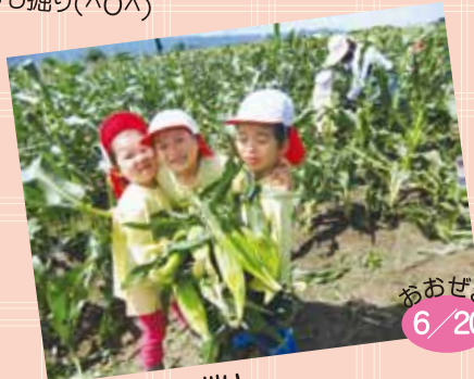
トウモロコシ刈り 上手にもぎ取ることができました!