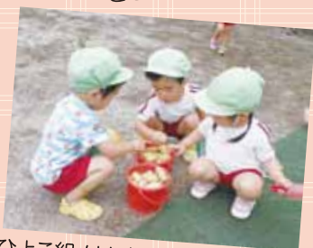
ひよこ組・はな組さんは園の畑で おいも掘り(ハハ)