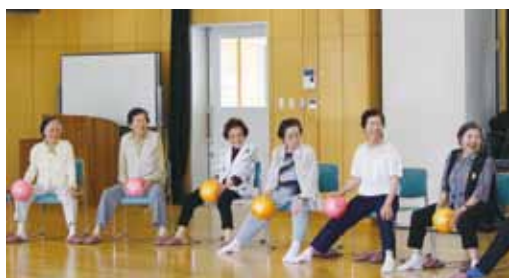
ボール体操で若返り中!