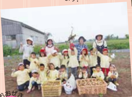
じゃがいも掘り どろんこになりながら掘りました