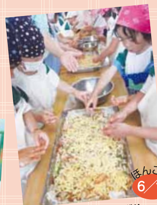
ピザポテト作りに挑戦!! 「チーズをのせて… はい、できあがり!!」