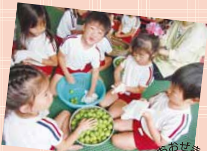
梅つけ体験 今年も挑戦しています！

涙を流しながら登園していた子どもたちも、今ではすっかり園の生活に慣れ、いろいろな行事や活動に取り組んでいます。