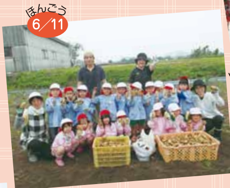
じゃがいも掘り 「た～くさんとれたよ！」