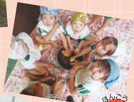
クッキング しんじゃがだから皮も 手でむけるほど！