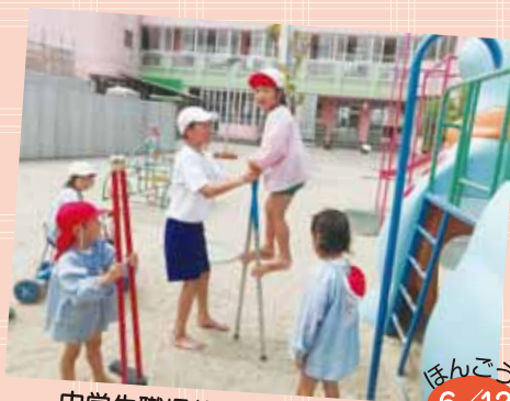
中学生職場体験 「いっぱい遊んでくれてありがとう♡」