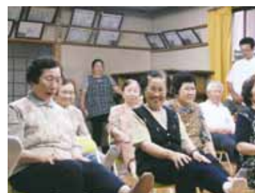
リハビリ体操で笑顔全開!

思えばスロージョギングにハマっていた頃はいろいろと良いことがありました。体が軽くなったと感じたり、気持ち若返ったり、「今日は〇〇キロ走ったばい」と仲間と盛り上がった。もう一度アノ頃に戻りたい。よし！もう一度走ります！...と自分の背中を押すためにこの欄をお借りしました。みなさんも一緒に始めませんか？イイことありますよ (笑)