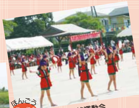
本郷小学校運動会 沖縄伝統芸能「エイサー」を 元気いっぱい踊りました