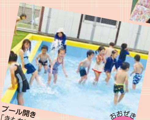
プール開き 「きもちいい～☆わ～！ つめた～い♪」