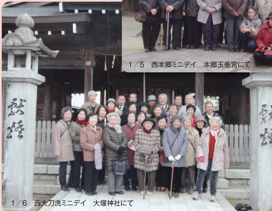
1/6 西大刀洗ミニデイ 大堰神社にて