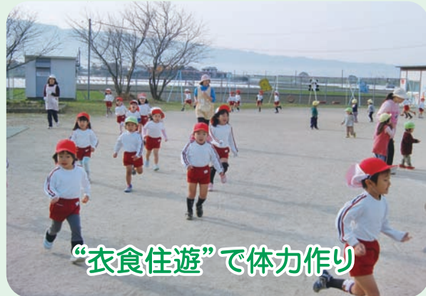
“衣食住遊”で体力作り

「広～い園庭を走り回る」日常保育の中で体力作りの基となることがいくつもあります。