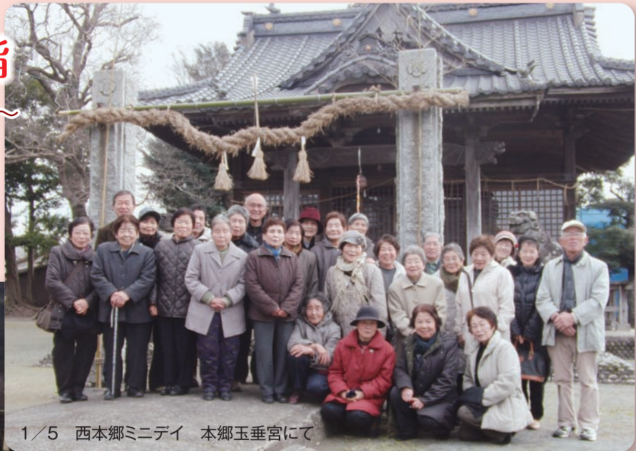
1/5 西本郷ミニデイ 本郷玉垂宮にて