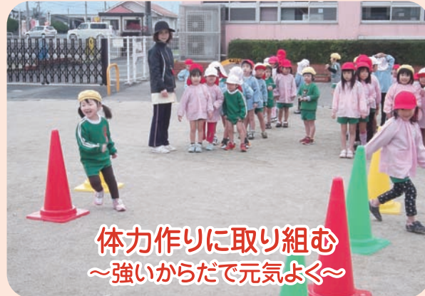
体力作りに取り組む ～強いからだで元気よく～

寒さが厳しくなってきましたが、それでも子どもたちはいつもパワー全開。「子どもは風の子」まさにその言葉どおり、園庭では戸外遊びを楽しむ子どもたちの元気いっぴいな声が響いています。