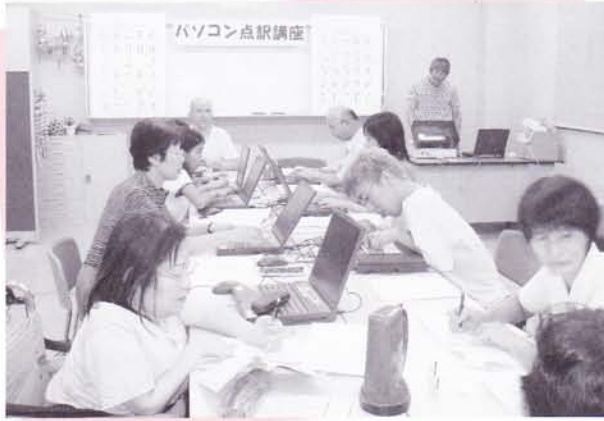
ボランティア活動の推進（パソコン点訳講座）