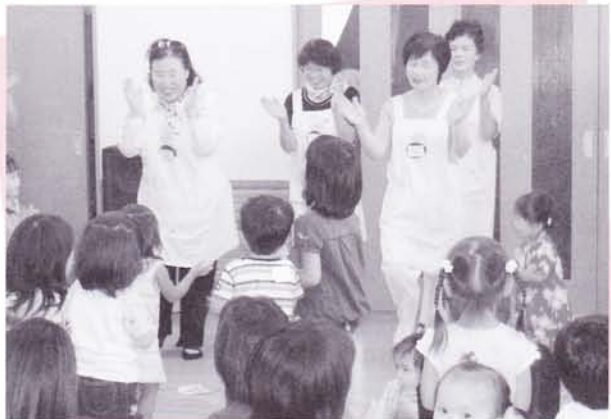
子育て支援の推進 (子育て支援センター夏まつり)