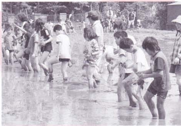
福祉教育の推進（福祉協力校事業）