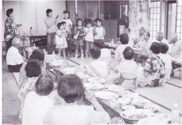
住民主体の地域福祉活動の推進 (ミニデイサービス事業)