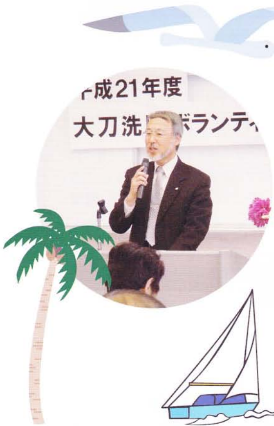
平成21年度 大刀洗町ボランティア