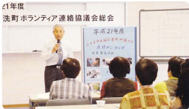
環境ボランティア「たけのこクラブ」の活動紹介の様子

そんな中で新しい仲間、矢車草（車椅子レクダンス）の入会があり、グループ数がひとつ増えて12となり喜びもひとしおです。総会の後では、その12のグループがそれぞれ工夫を凝らした活動紹介をし、会場は大いに盛り上がりました。日頃、様々な活動の中で豊かな表現力を身につけている皆さんだけに、どのグループもステキなミニステージや、ボランティアに対する熱い想いの報告があり、大刀洗のボランティアの明るい未来を確信した総会でした。